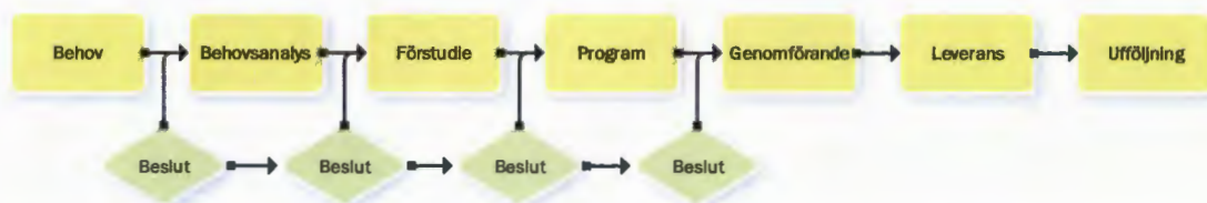
Figur 1 - Fastighetsinvesteringsprocessen

Utgångspunkten är att ett behov av lokalförändring identifieras. Ett första ställningstagande blir då om behovet ska utredas d.v.s. om en behovsanalys ska göras. Därefter